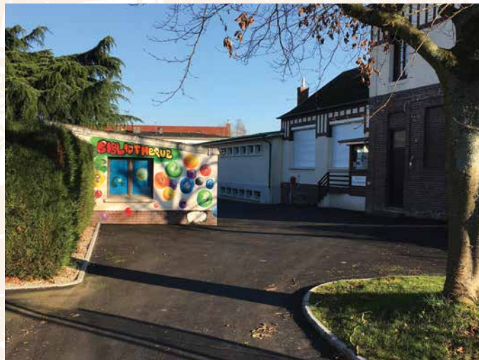
• Réaménagement de l'accès à la bibliothèque