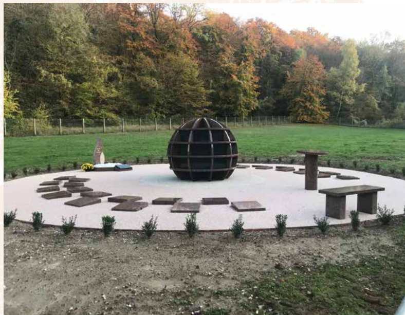
• Cimetière - nouvel espace de recueillement