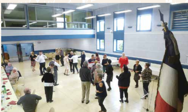
• 8 mai : On danse à l'ombre du drapeau !