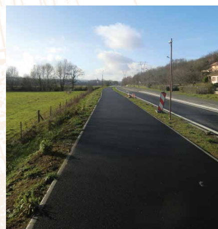
• Accès piétons à la Voie verte