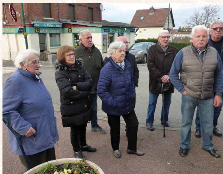
• Nos trois disparus