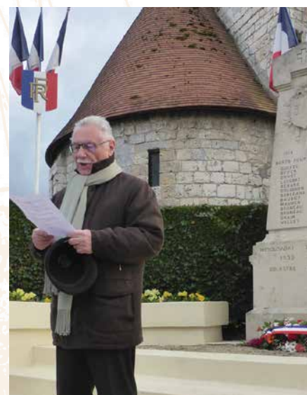
• 19 mars : le vice-président lit le message officiel