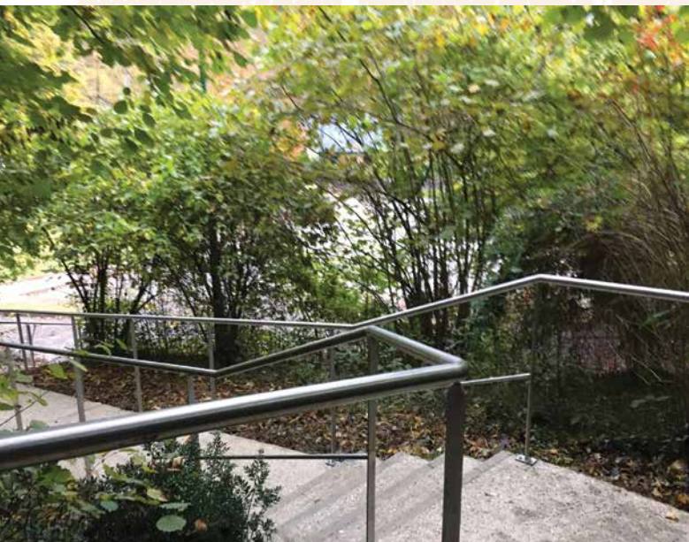
• Garde-corps escalier vers parking Mairie

Tout arrive ! Pour qui sait être patient. La métropole n'existait pas encore que la reconversion de la voie