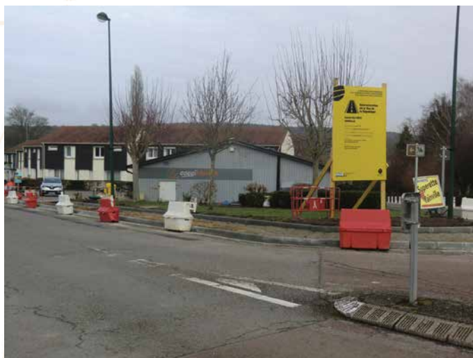
• Restructuration rue de la République