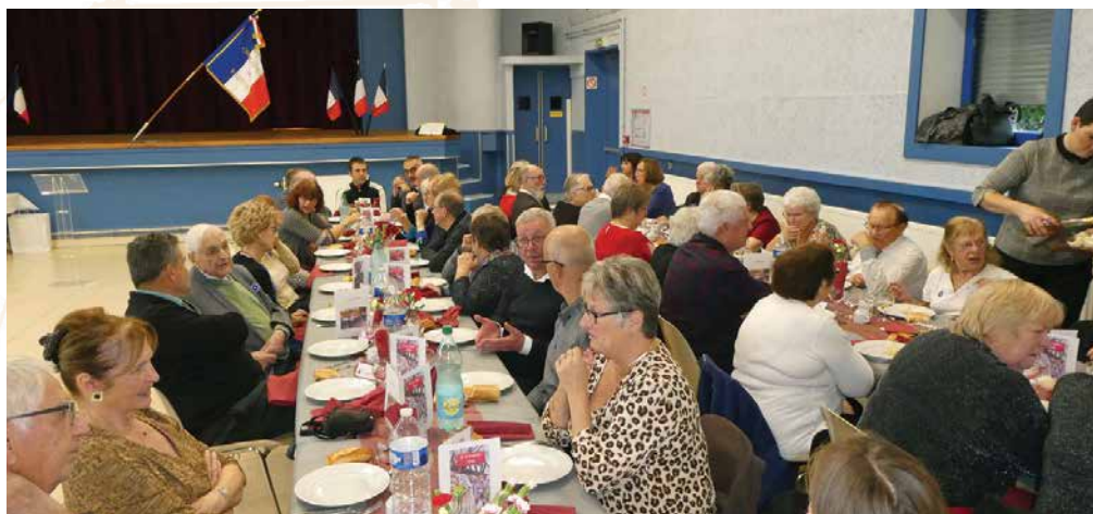
• 11 nov. : Une joyeuse tablée