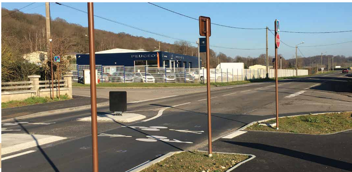
• Sécurisation accès piétons à la Voie verte

fermée en voie verte était déjà inscrite dans le cadre de la charte du Parc 2001-2011. Le projet était au point mort mais vers 2015, la Métropole a repris le sujet pour aboutir à la voie verte tel qu'elle est aménagée aujourd'hui entre Duclair et Le Trait. Peut-être l'avez-vous déjà empruntée à pied ou à vélo ? Dans le cadre de cette voie verte, la traversée du RD982 a été sécurisée entre la rue de l'essart et la rue Racine avec un cheminement jusqu'au RD 143 pour les Yainvillais.