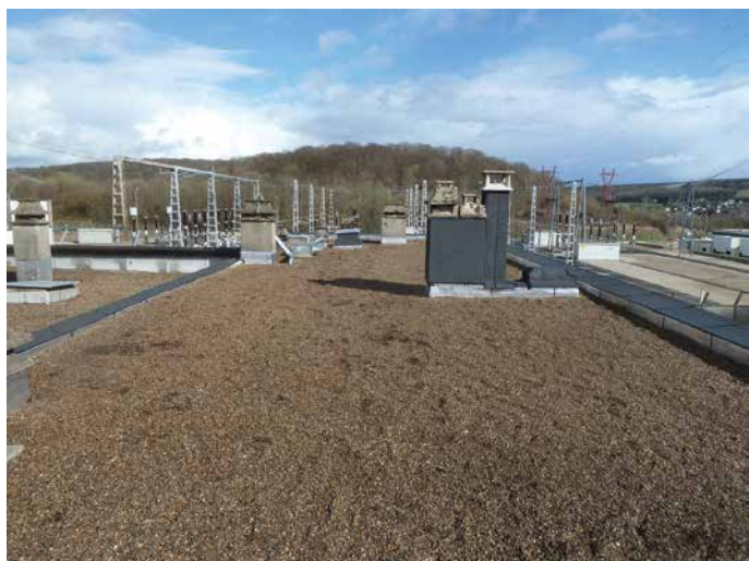
• Toit-terrasse logements rue du Bac