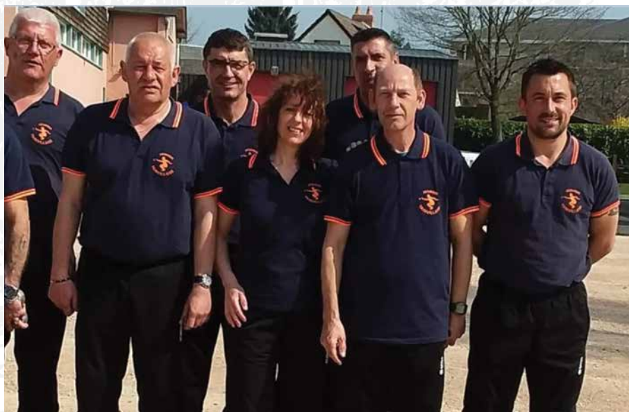
• L'équipe finaliste

Le concours départemental d'Yvetot, les concours qualifications tripléte à Sainte Lucie, le Doublette à Saint Pierre les Elbeuf et Tête à Tête à Harfleur ainsi qu'un concours promotionnel tripléte à Sotteville lès Rouen.