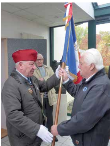
• 11 nov. : Remise du nouveau drapeau