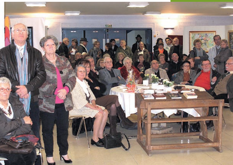
> L'atelier Jazz du Conservatoire a retenu l'attention du public.