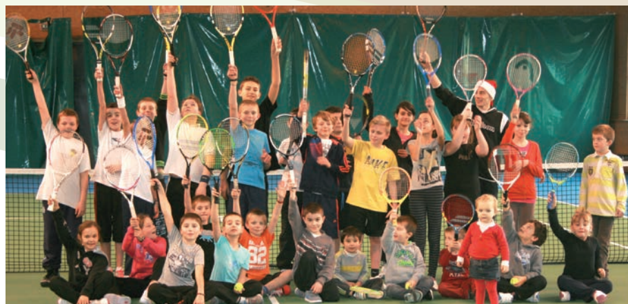
> Les enfants de l'école de tennis posent pour le père Noël.