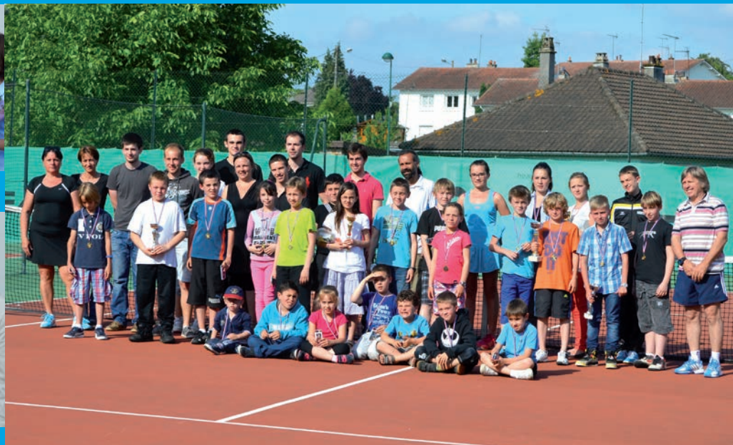
> Participants au tournoi du 30 juin 2013.