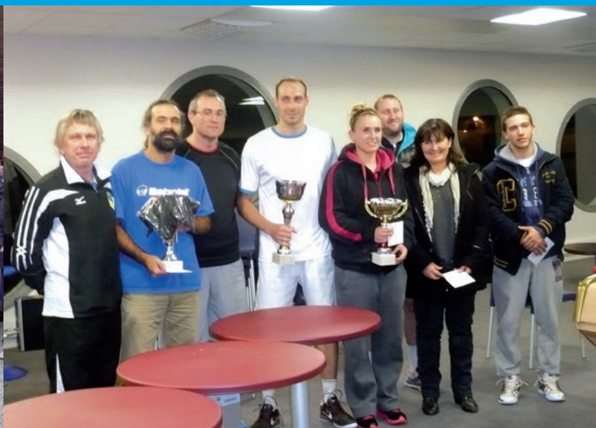
> Les vainqueurs, finalistes du tournoi au côté du président et du juge arbitre du tournoi (à G)